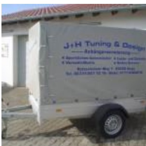
Humbaur mit Plane