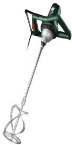
Mörtelrührer / Rührfix