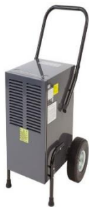
Bautrockner und Luftentfeuchter