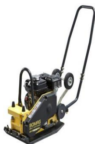
Bomag Verdichtungstiefe bis 25cm