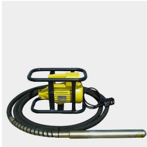
Innenrüttler / Betonrüttler