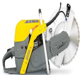
Trennjäger / Trennschneider