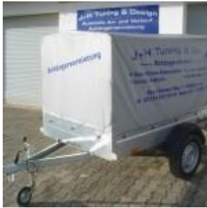
Brenderup mit Plane