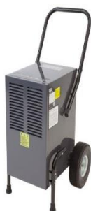
Bautrockner und Luftentfeuchter