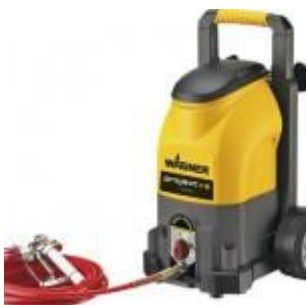
Wagner Airless Farbspritze